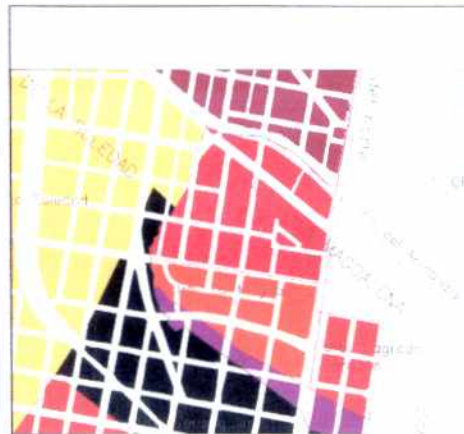
PLANO DE URBANIZACIONES

La circunstancia de no quedar sobre vías arterias oriente-occidente, pudo haber sido la causa de su excepcional conservación. Las áreas verdes de antejardines y calles ofrecen, junto con la escala de sus viviendas de dos pisos un panorama urbano singular.